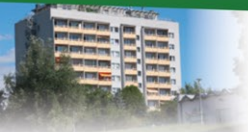
Segelteichstraße 34, Sondershausen

Wohnfläche: ca. 25 m 2 Kaltmiete: 151,68 Euro zzgl. BK und HK Kautions: 310 Euro 75,8 kWh/(m 2 a), Fernwärme, Baujahr 1979 Verbrauchsausweis