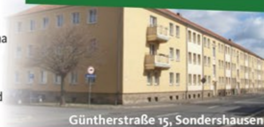
Güntherstraße 15, Sondershausen

Wohnfläche: ca. 62 m 2 Kaltmiete: 339,90 Euro zzgl. BK und HK Kautions: 680,00 Euro 124,8 kWh/(m 2 a), Gas, Baujahr 1954 Verbrauchsausweis